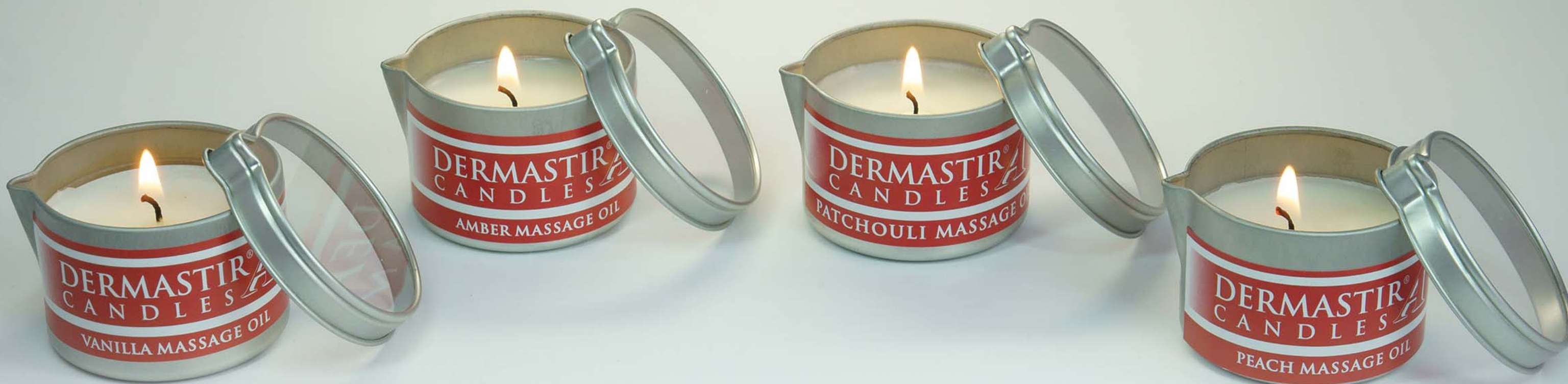
DERMASTIR OLIO DI CANDELA DA MASSAGGIO VANIGLIA 35g/150g